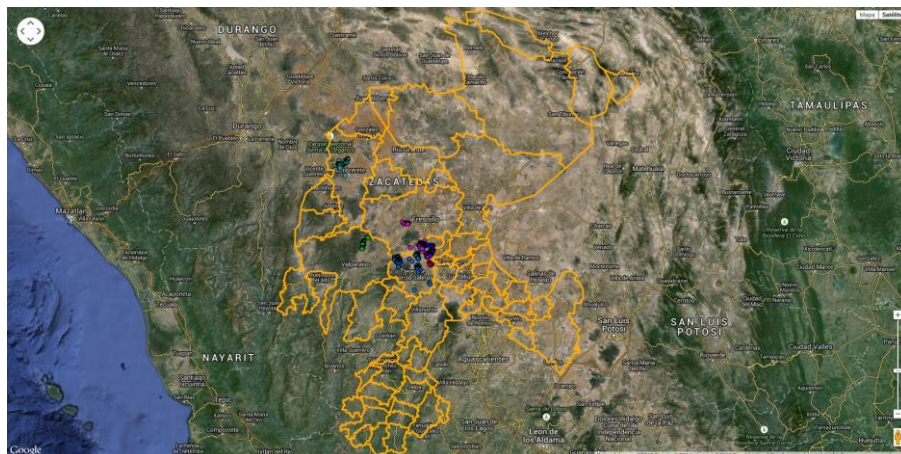
Muestreo realizados en 2014.

Entrenamiento: Actividad enfocada a dar a conocer a los productores la forma más adecuada para llevar a cabo las acciones hacia un manejo integrado de la plaga, mencionando aspectos sobre biología, ecología y hábitos de la misma.